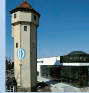
Der alte Gersthofer Wasserturm war die „Keimzelle“ des Ballonmuseums.

Computer ergänzen die Exponate. Die beiden Brüder Montgolfier oder Professor Charles, die 1783 den Ballon erfanden, kommen selbst zu Wort.