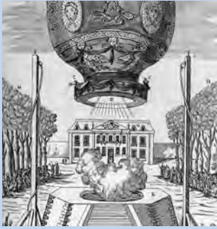
Zeitgenössische Darstellung des Starts der ersten Montgolfière (1783). Das Ballonmuseum Gersthofen zeigt auch den Ballon, der als erster die Welt umrundete.